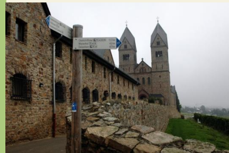
Kloster Hildegard von Bingen

Sehenswert: Abtei St. Hildegard von Bingen