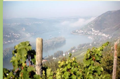
Blick zurück auf Lorch

Kurzbeschreibung: Länge: ca. 14,4 km, Zeit: ca. 5:30 Std. Bewertung *** Einkehrmöglichkeiten: Campingplatz Suleika, Assmannshausen Rastplätze: Georg`s Ruh, Gerd-Simons-Hütte