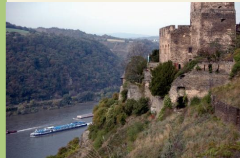
Die Burg Gutenfels bei Kaub