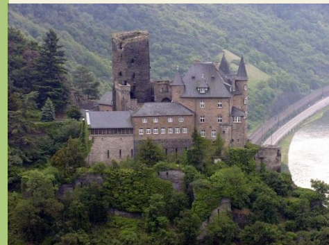
Blick auf Burg Katz