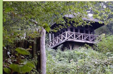
Rekonstruktion eines Limeswachturms

Sehenswert: Schloss Sayn, Festung Ehrenbreitstein