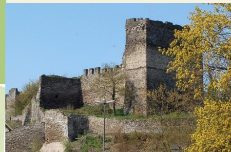
Die Burg Altewied thront über der Wied