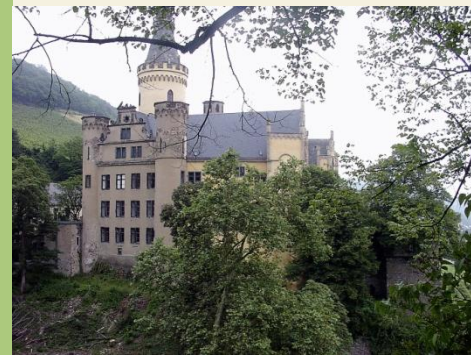
Schloss Arenfels bei Bad Hönningen