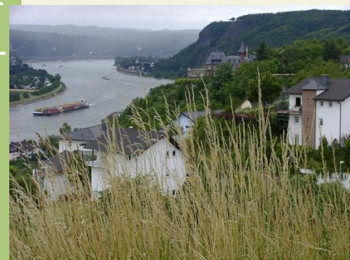
Blick zurück auf Rhein und Erpeler Lay

Kurzbeschreibung: Länge: ca. 25 km, Zeit: ca. 8:10 Std. Bewertung *** Einkehrmöglichkeiten: Erpeler Lay, Linz, Bad Hönningen