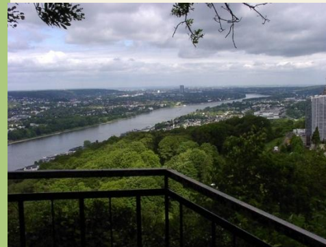
Blick zurück auf Bonn