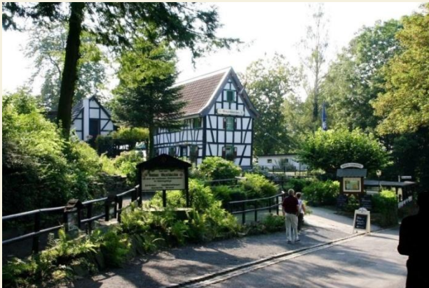
Das Winzerhäuschen auf dem Drachenfels

Es gibt immer wieder schöne Ausblicke auf Bonn, den Venusberg und Bad Godesberg.