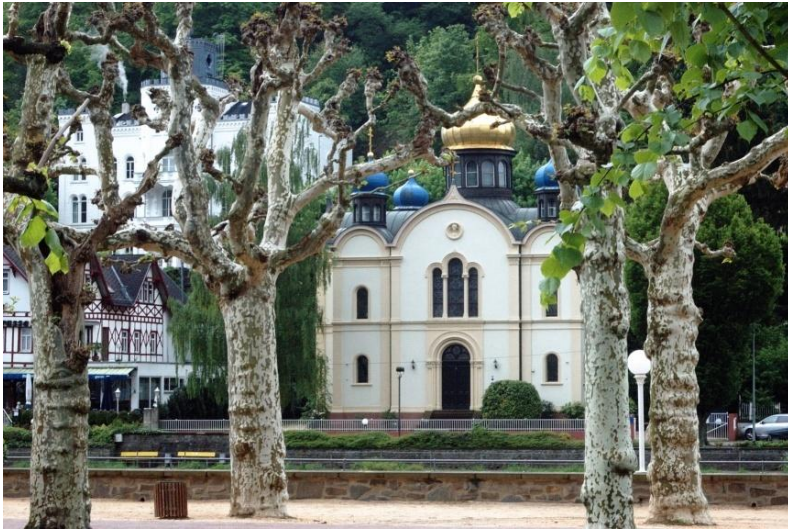
Russische Kapelle in Bad Ems