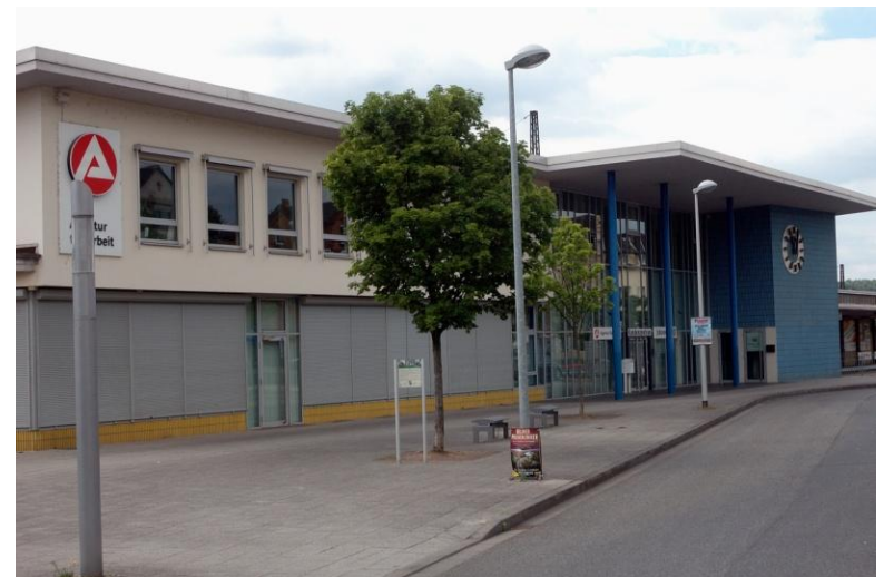
Die Tour endet am Bahnhof Lahnstein