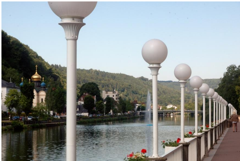
Im Hintergrund die russische Kapelle