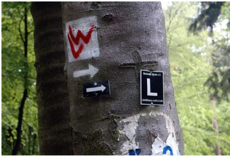
Rotes L und W auf weißen Grund ist die Markierung des Lahnwanderweges