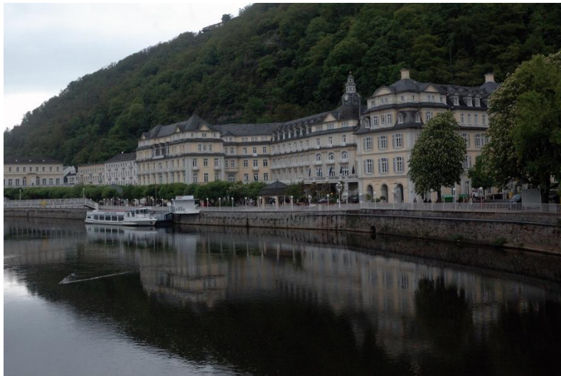
Häckers Kurhotel Bad Ems