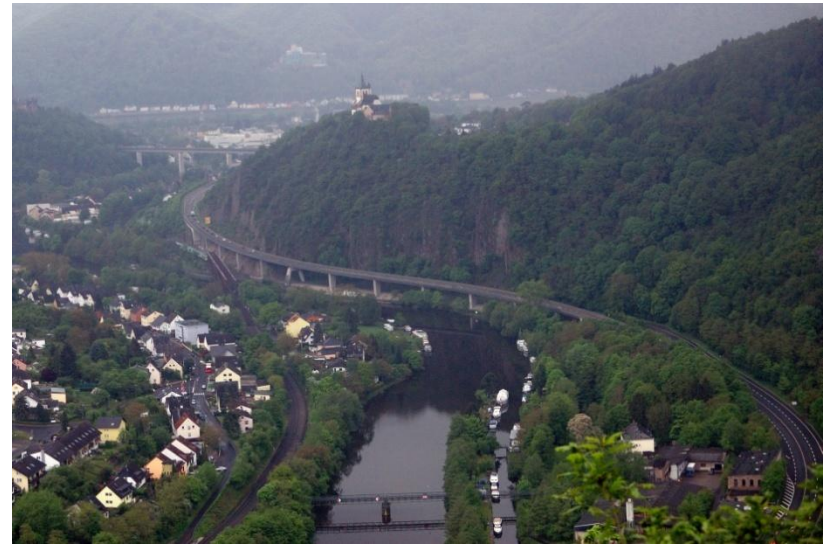
Blick in das Lahntal bei Lahnstein