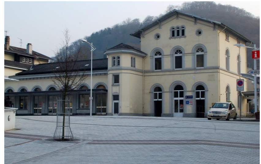
Die Tour beginnt am Bahnhof in Bad Ems