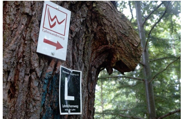
Wir folgen der Markierung weißes L auf schwarzem Grund