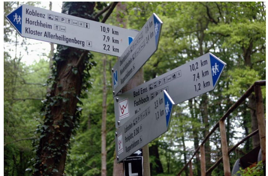
Viele Ziele –viele Wege