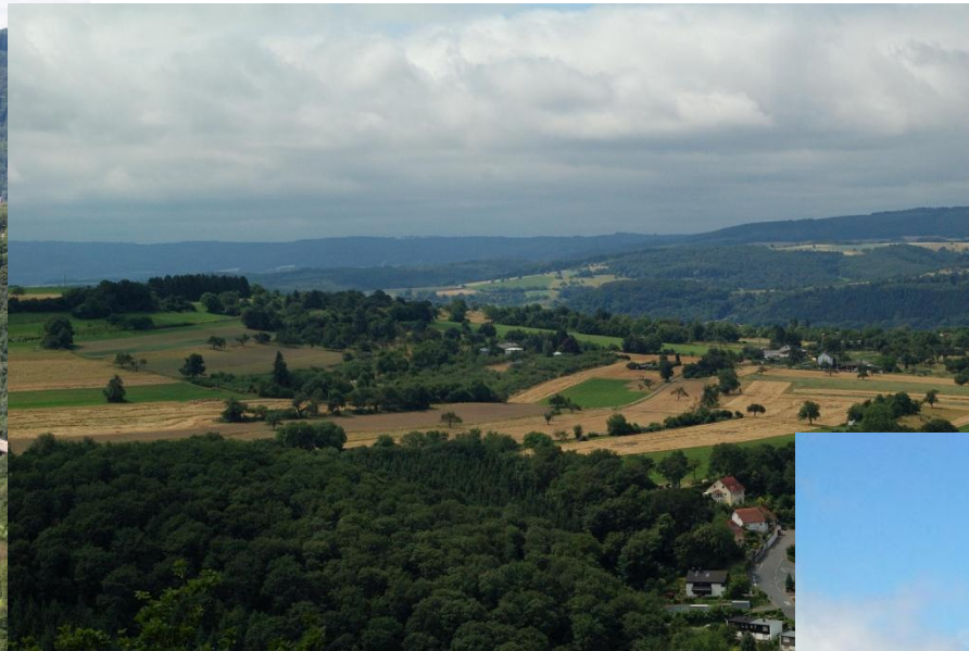
Blick über die gegenüberliegenden Lahnhöhen