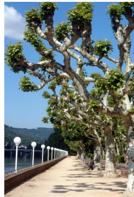
Entlang der Uferpromenade