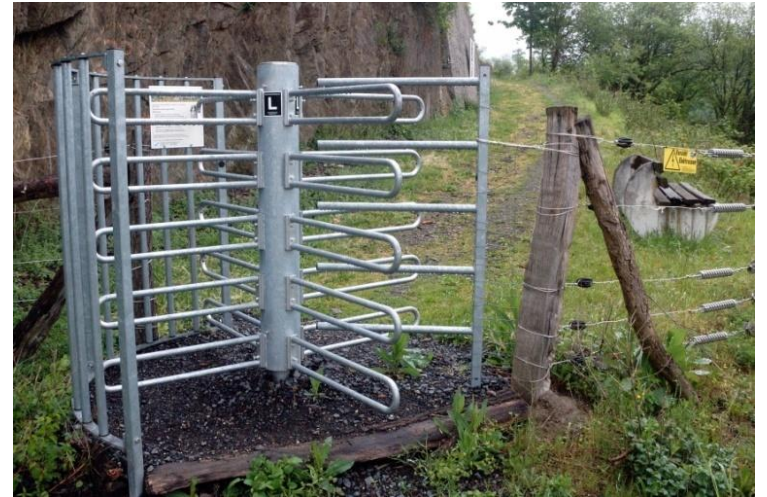
Der Weg geht durch ein Wildziegehege