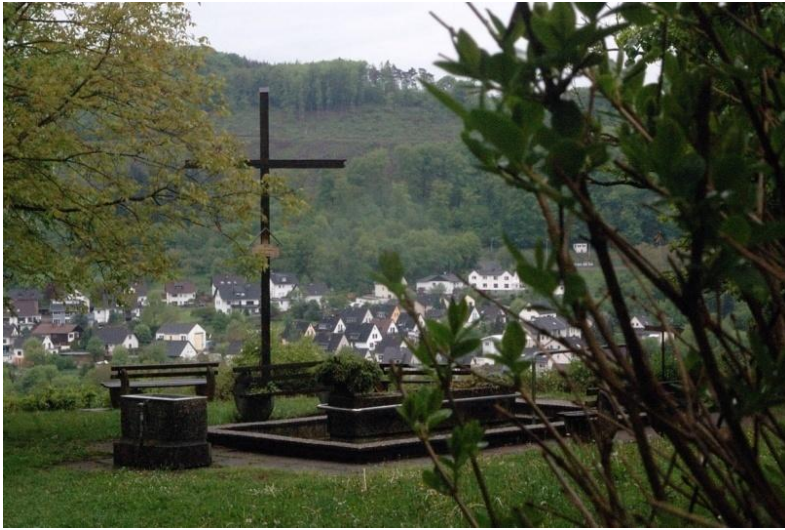
Kneipanlage oberhalb von Fachbach