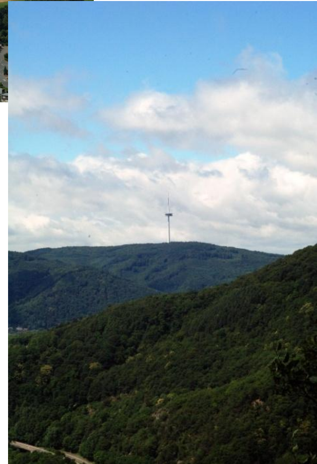
Blick zurück auf den Fernmeldeturm Kühkopf oberhalb von Koblenz