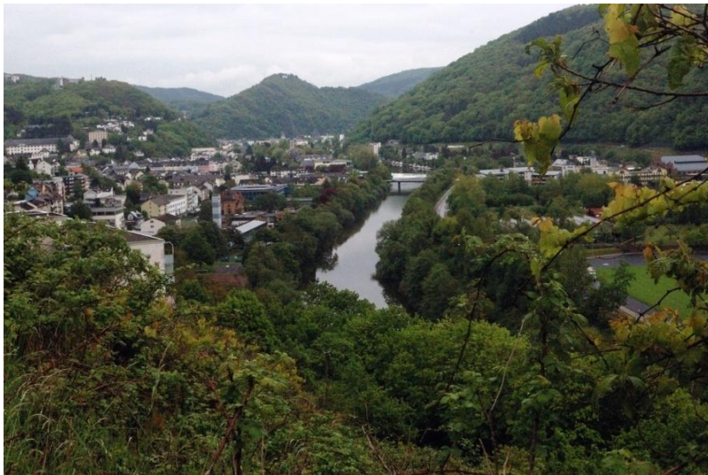
Blick auf Bad Ems