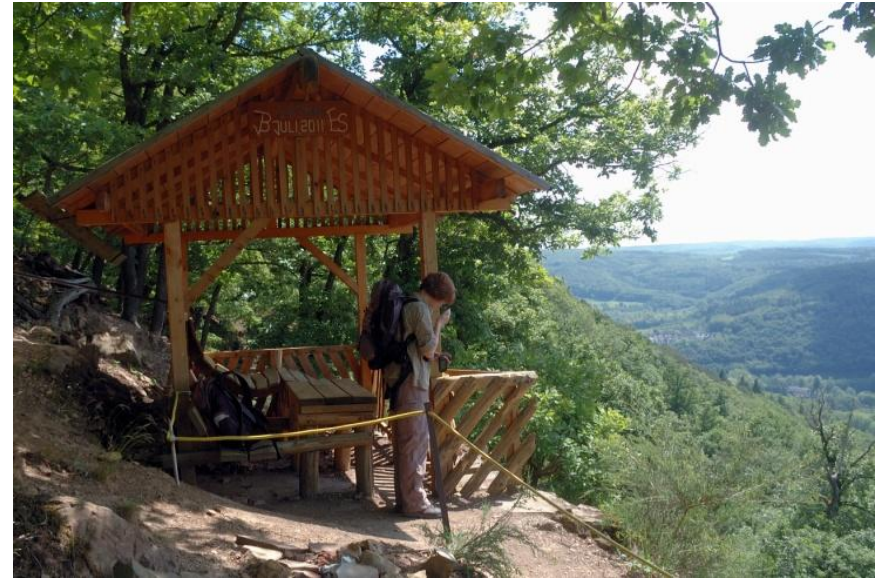
Ein besonderer ‚Rastplatz mit herrlichen Blick