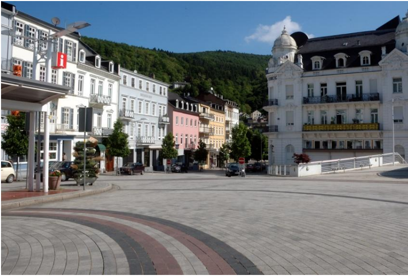
Bahnhofsvorplatz in Bad Ems