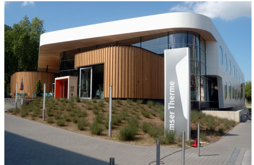
Die Tou´r endet am Bahnhof in Bad Ems