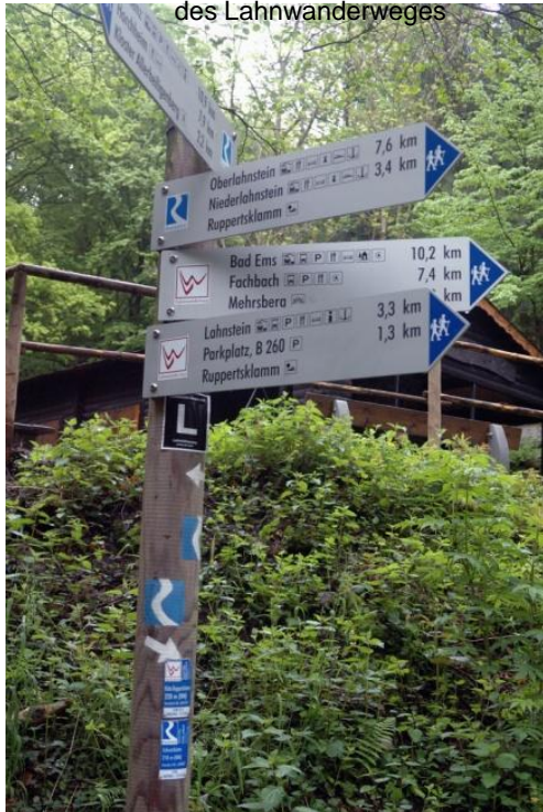
Viele Ziele –viele Wege