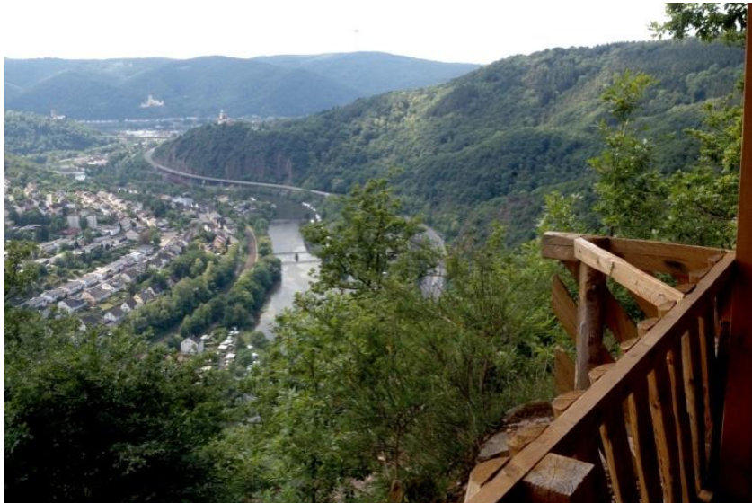
Blick auf die Lahn – im Hintergrund ist das Rheintal erkennbar