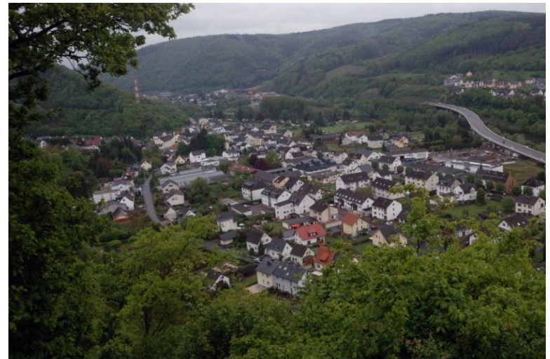
Blick auf Fachbach