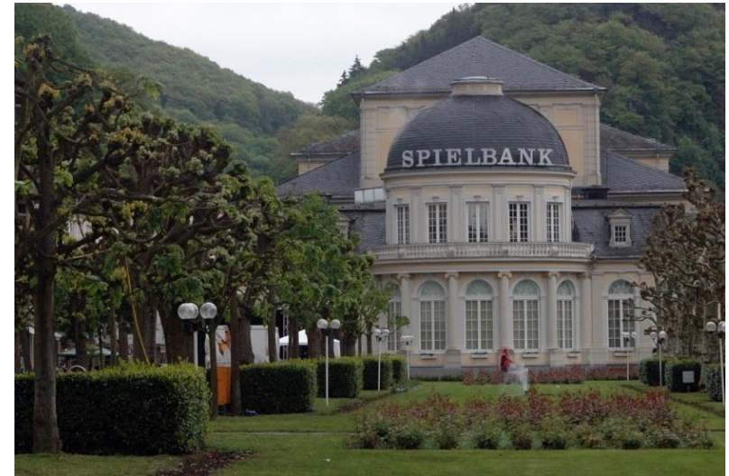
Spielbank in Bad Ems