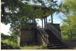
In der Nähe von Bad Ems gibt es viele Aussichtspunkte

Nun verfolgen wir einfach nur noch den Weg bergab und erleben einen kuriosen Abschluss eines schönen Wandertages: wir werden durch das Treppenhaus des Parkhauses geleitet. Unten angekommen stoßen wir auf eine Straße, biegen hier zunächst links und dann rechts ab. Wenn man mag und noch Zeit hat, kann man noch in eines der zahlreichen Cafés einkehren. Ansonsten queren wir die Lahnbrücke und gehen die Bahnhofstraße geradeaus bis zum Bahnhof (5 ½ Std; 17 Km).