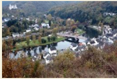
Blick zurück nach Obernhof

Überwiegend wird der Wanderer durch den Wald geführt, nur im Bereich der Ortschaften naturgemäß nicht. Es gibt einige wunderschöne Ausblicke auf dieser Etappe, die aber auch recht anstrengend ist. Da freut man sich auf die Bänke, die überall da stehen, wo es etwas zu gucken gibt. Der Abstieg vom Concordiaturm nach Bad Ems ist steil und bei feuchtem Wetter auch unangenehm zu gehen.