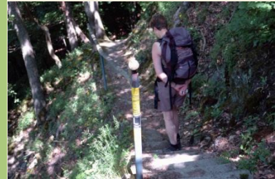
Auf schattigen Weg nach Nassau

Gegenüber vom Restaurant biegt ein schmaler Waldweg, markiert mit L und dem LW, ab, dem wir folgen. Zu Beginn ist der Pfad zum Teil recht steil und auch mit Fels durchsetzt, sodass man bei nassem Wetter aufpassen muss. In Kehren wandern wir nun immer weiter bergab, vorbei an wunderschönen Aussichtspunkten bis das wir zu einer weiteren Weggabelung kommen. Grundsätzlich kommt man auf beiden Wegen nach Bad Ems. Der linke Ast bringt uns aber nach wenigen Metern zu den Heinzelmanns Höhlen, die sich vermutlich in der Eiszeit gebildet haben.