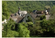
Blick auf Weinähr