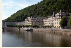
Häckers Kurhotel Bad Ems