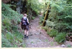
Abstieg nach Bad Ems