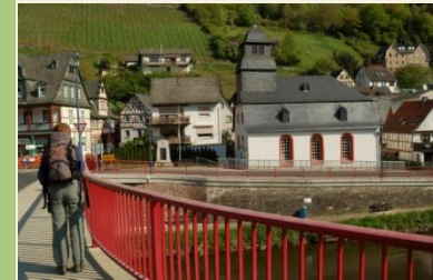
Zunächst überqueren wir die Lahn

Verkehrsverbindungen: Koblenz Hbf – Obernhof Bhf Bad Ems Bhf – Koblenz Hbf Bahn