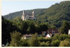
Kloster Arnstein oberhalb von Obernhof