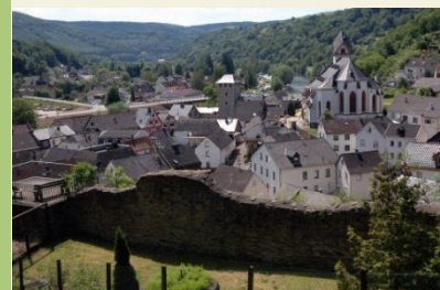
Blick auf die alte Stadtmauer in Dausenau