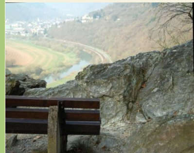
Rastmöglichkeit auf dem Weg nach Nassau